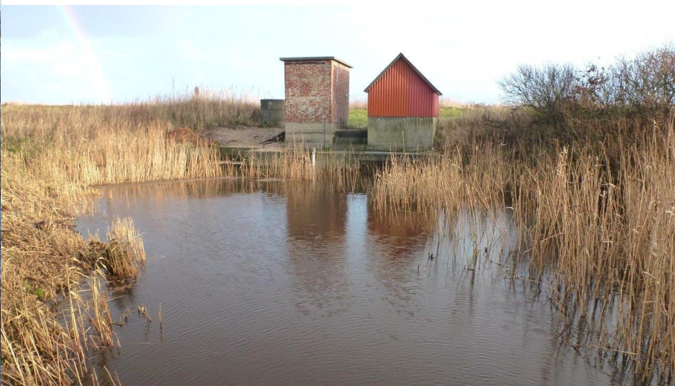
Pumpestationen ved Stausholm der bl.a. sikrer at vandet fra store dele af det område der hører under "Harboøre Pumpelag" afledes til Limfjorden. Vandet fra Vrist Pumpelag afledes hertil. Desuden ses toppen af diget der nu administreres af Harboøre Digelag af 2015