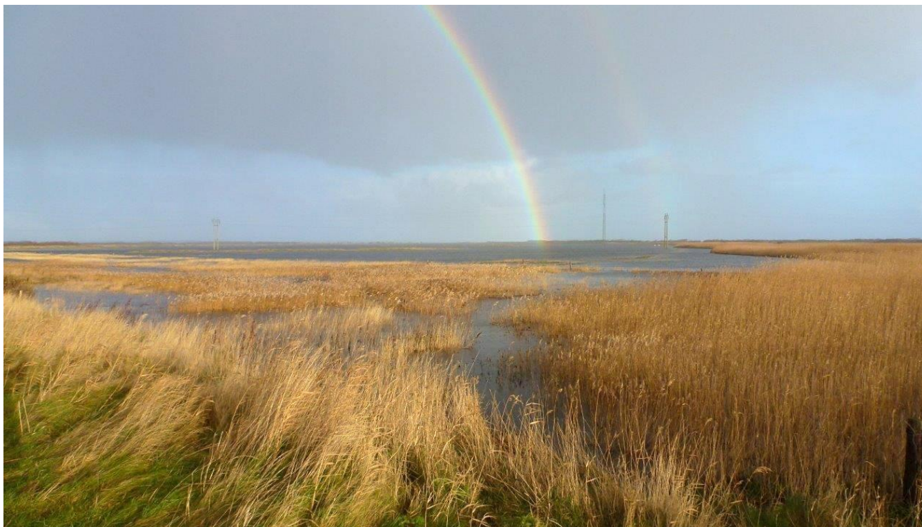
Foto fra toppen af diget ved pumpestationen viser at store landarealer ud mod Limfjorden er oversvømmet på grund af den høje vandstand i fjorden. (1.dec. 2015)