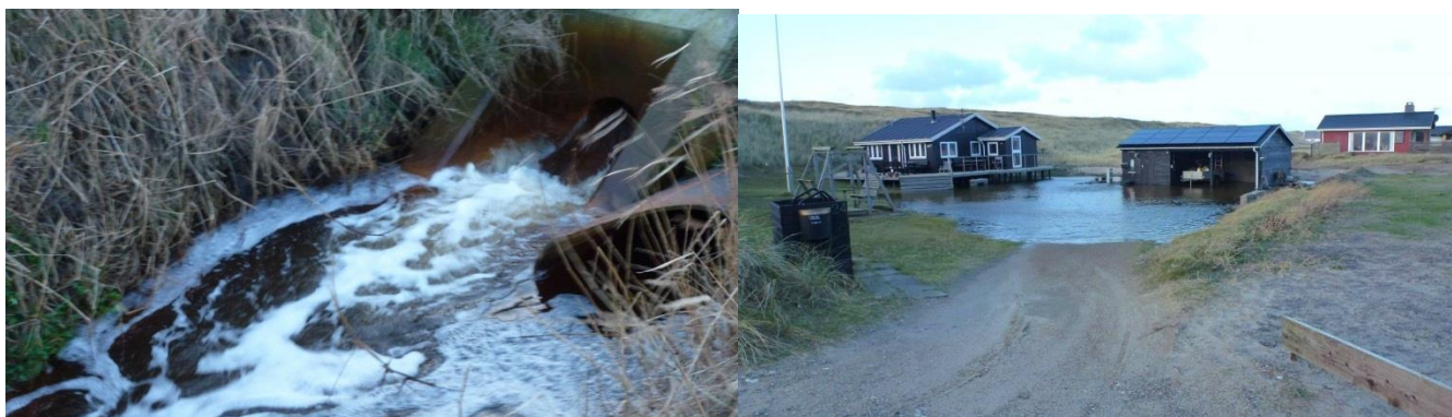
Afløb fra hovedpumpestation den 30.11.2015

Så der har igen i år været blankt vand omkring flere sommerhuse. Det er dog vores indtryk, at vandet meget hurtigt er væk igen når grundvandsstanden falder.